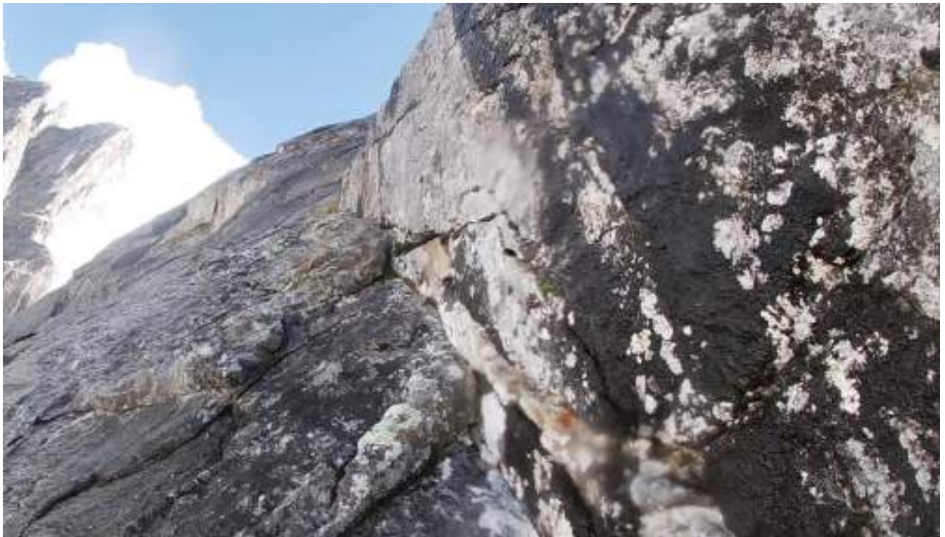
Фото №5 – Участок R7-R8 Лазание по мокрым скалам.