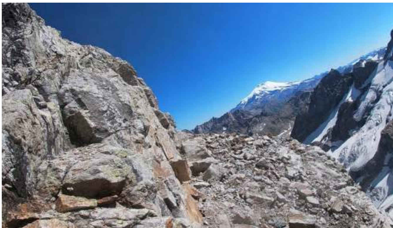
Фото №6 – Одновременное движение по гребню