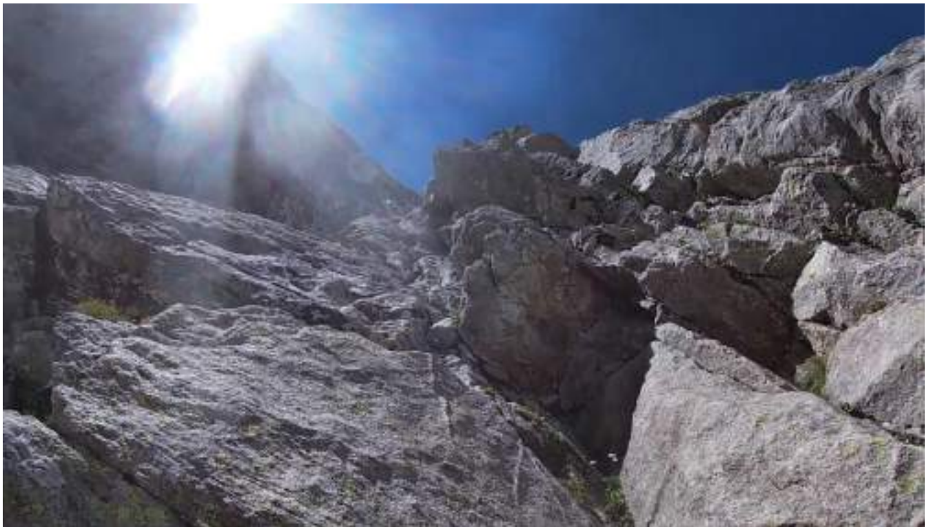
Фото №3 – участок R4 – R5