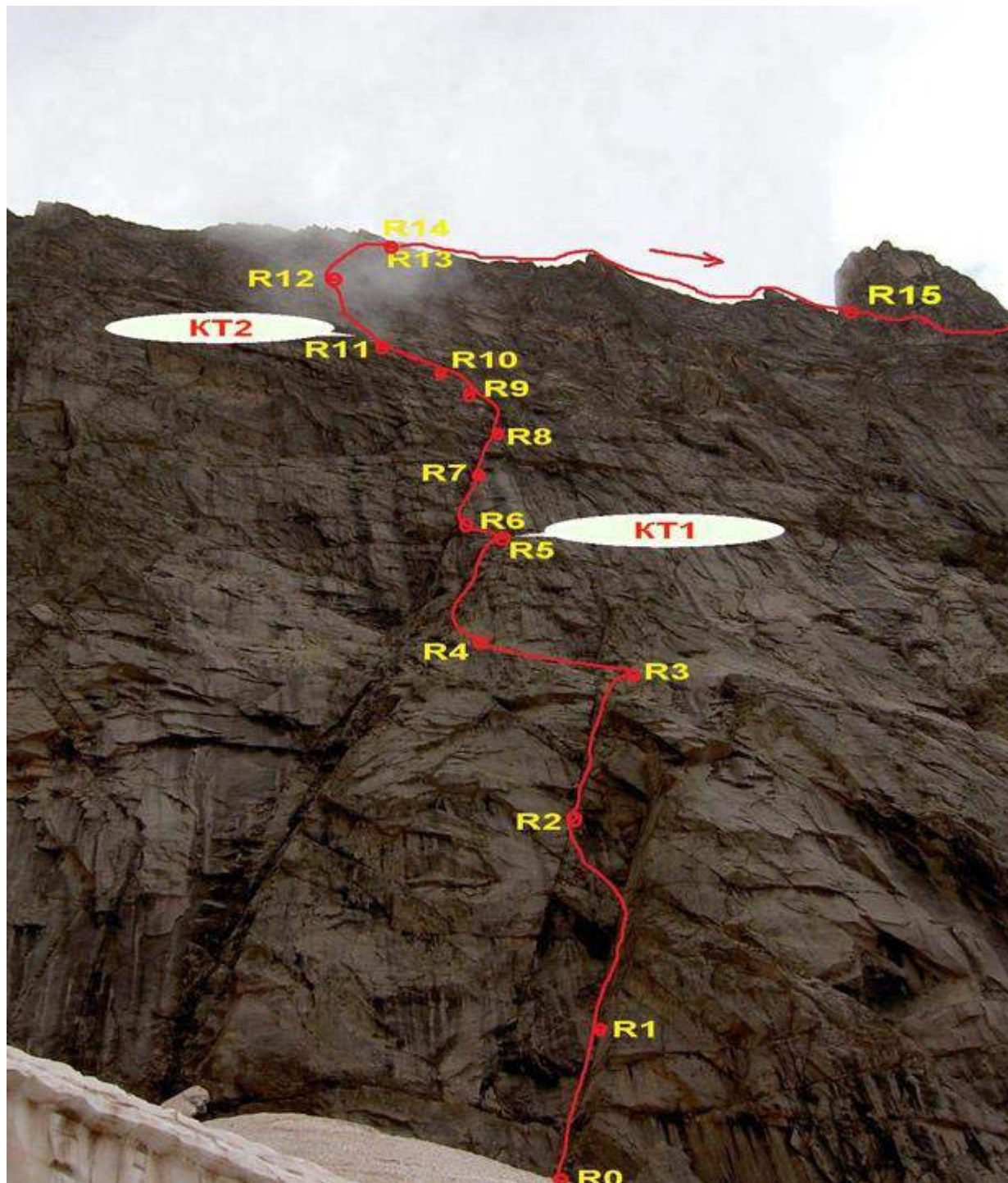
Вид на стенную часть. Ночевка 29.07.24 в районе 2 к.т. Дальнейший путь – по маршруту 5А (Кавуненко)