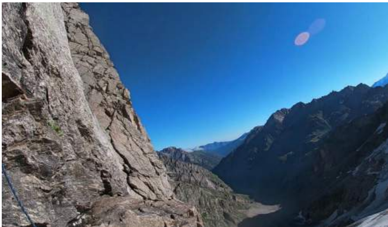
Фото №1 – Начало маршрута. Вид с большой полки.