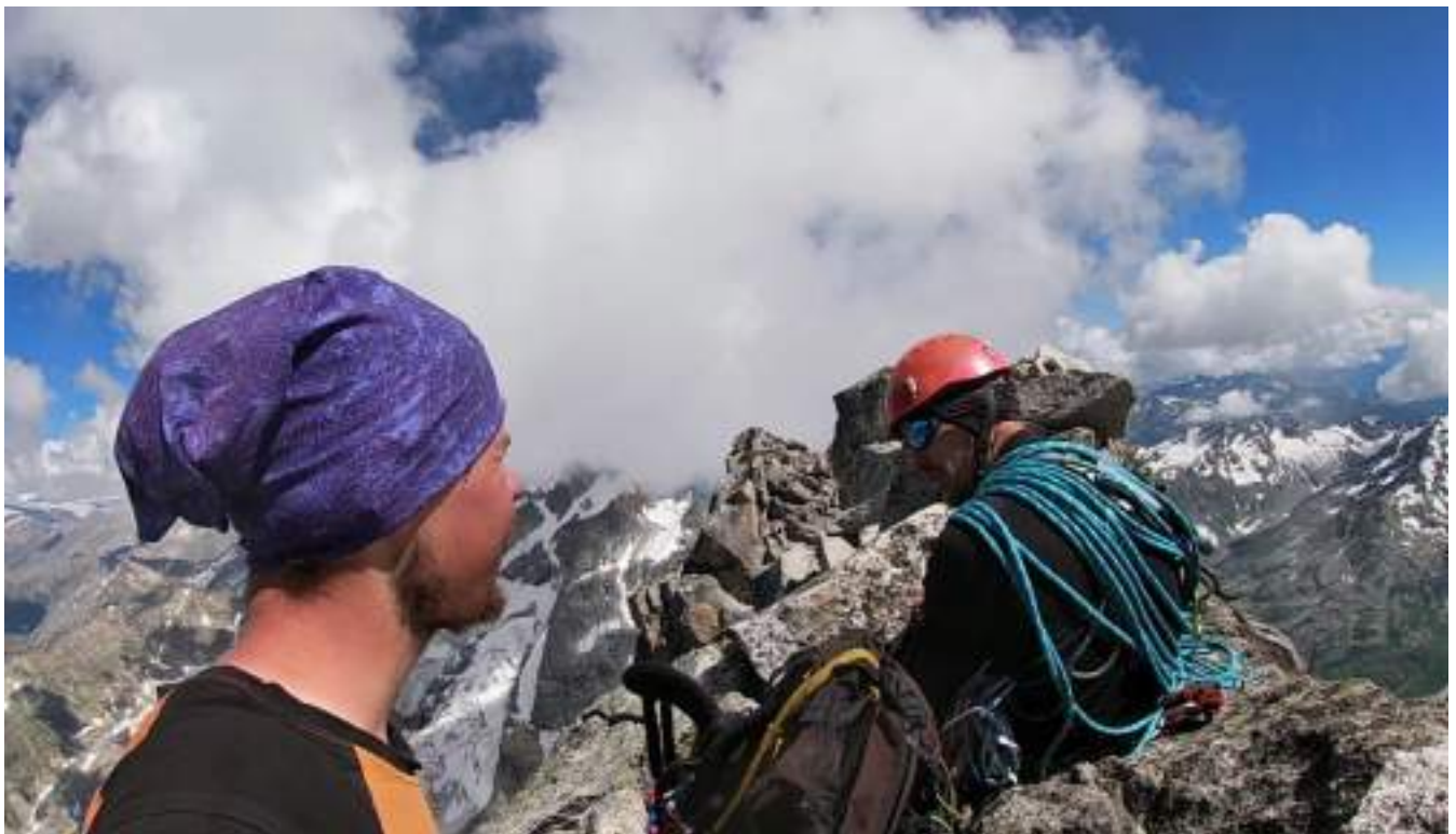
Фото №9 – На вершине. Снял каску, чтоб записать видео на экшн-камеру.