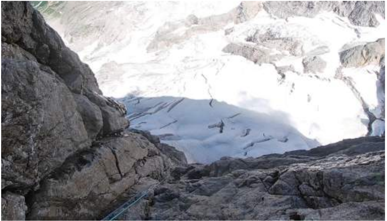
Фото №4 – Участок R6-R7. Мокрый внутренний угол. Вид со станции.