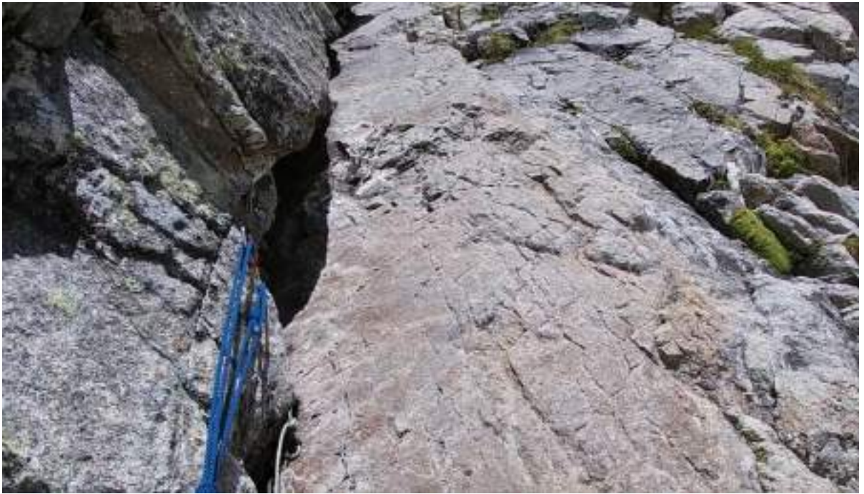
Фото №2 – Станция после второй веревки.