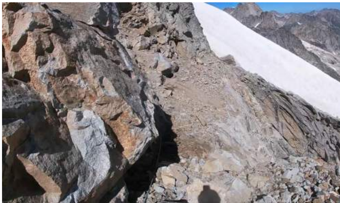
Фото №7 – Подошли к снежному ножу