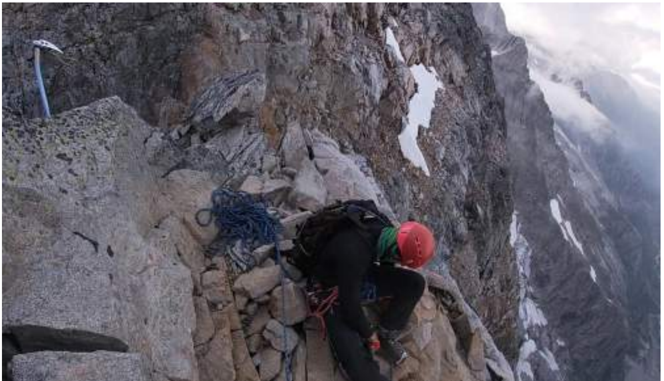
Фото №8 – Перед провалом в гребне. Недалеко от вершинной башни.