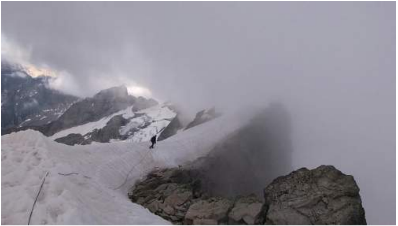
Фото №10 – Возвращаемся по снежному ножу. Погода портится.