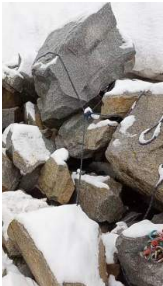
Фото №11 – Утро после грозы