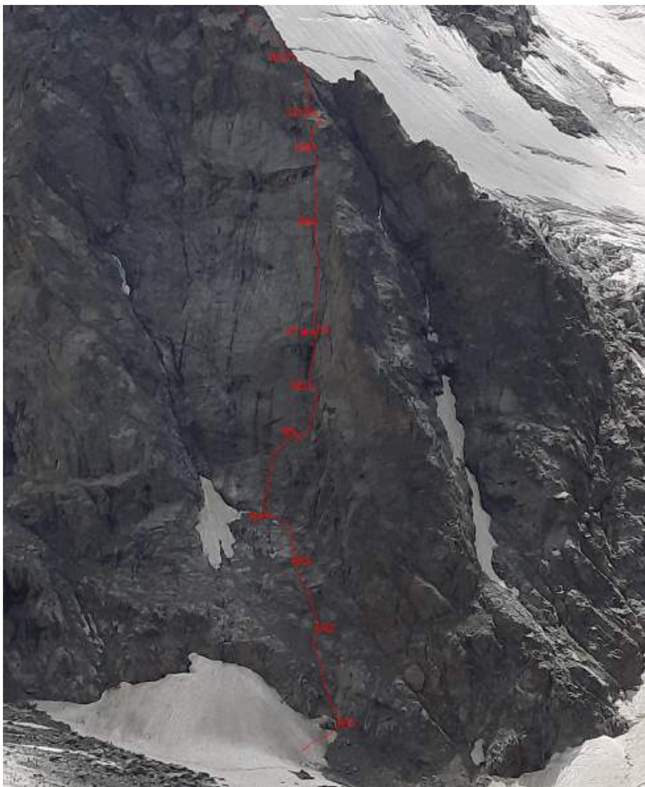
Рис. 7. Техническая фотография стенной части маршрута (фото сделано выше Средних Кичкидарских ночевок 08.08.2024г.)