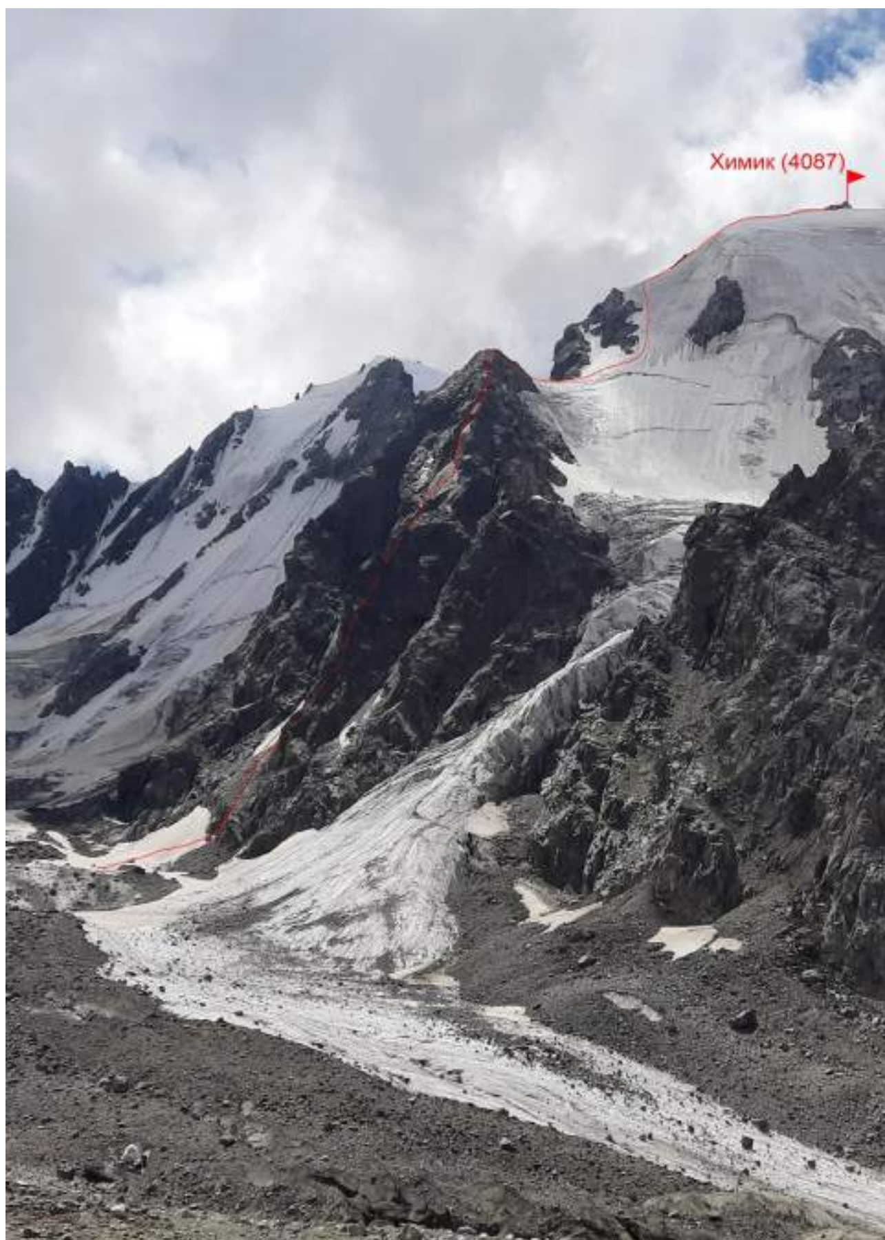
Рис. 2. Фото профиля маршрута (фото сделано 08.08.2024 между Нижними и Средними Кичкидарскими ночевками)