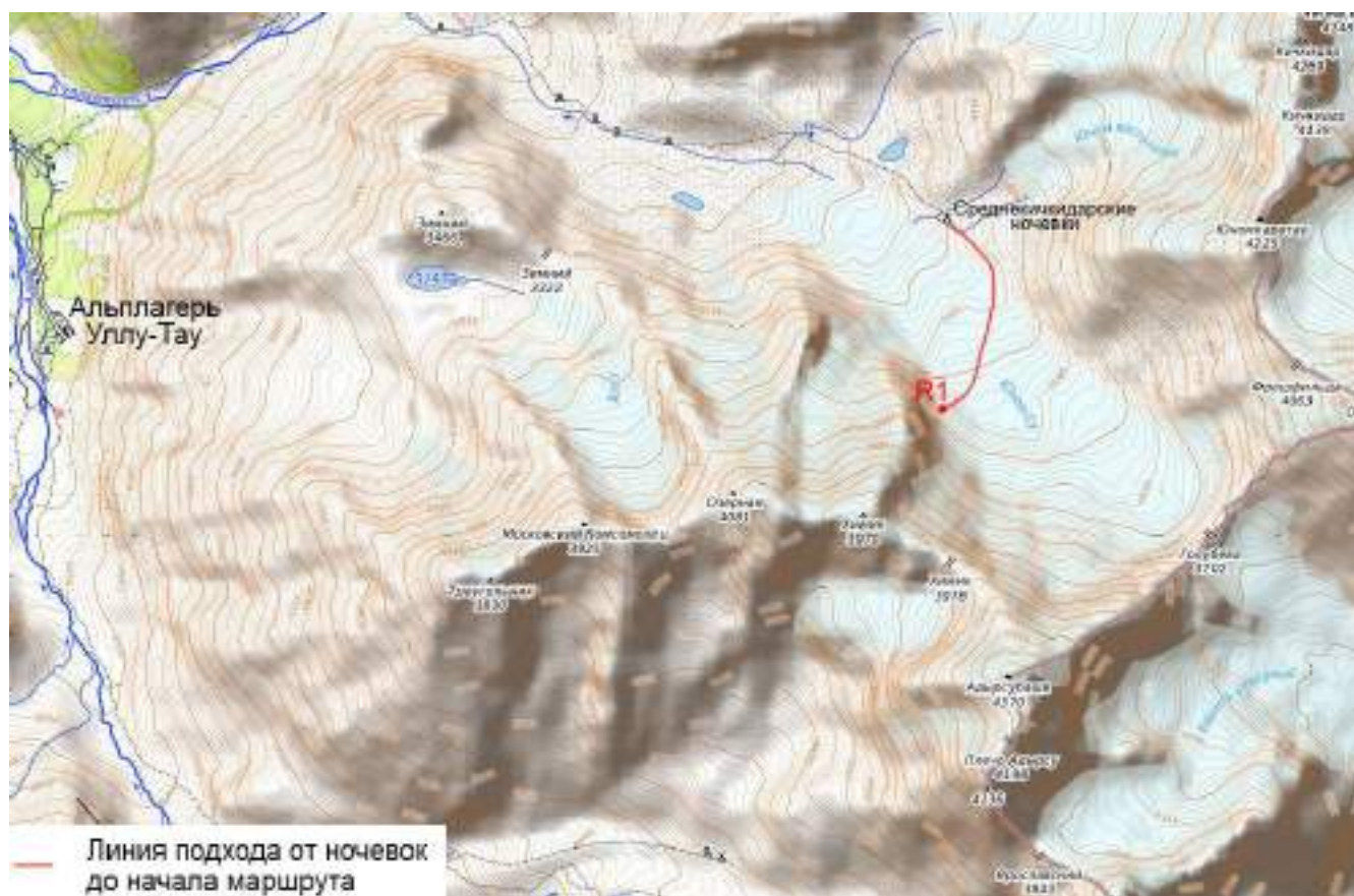
Рис. 5. Карта района