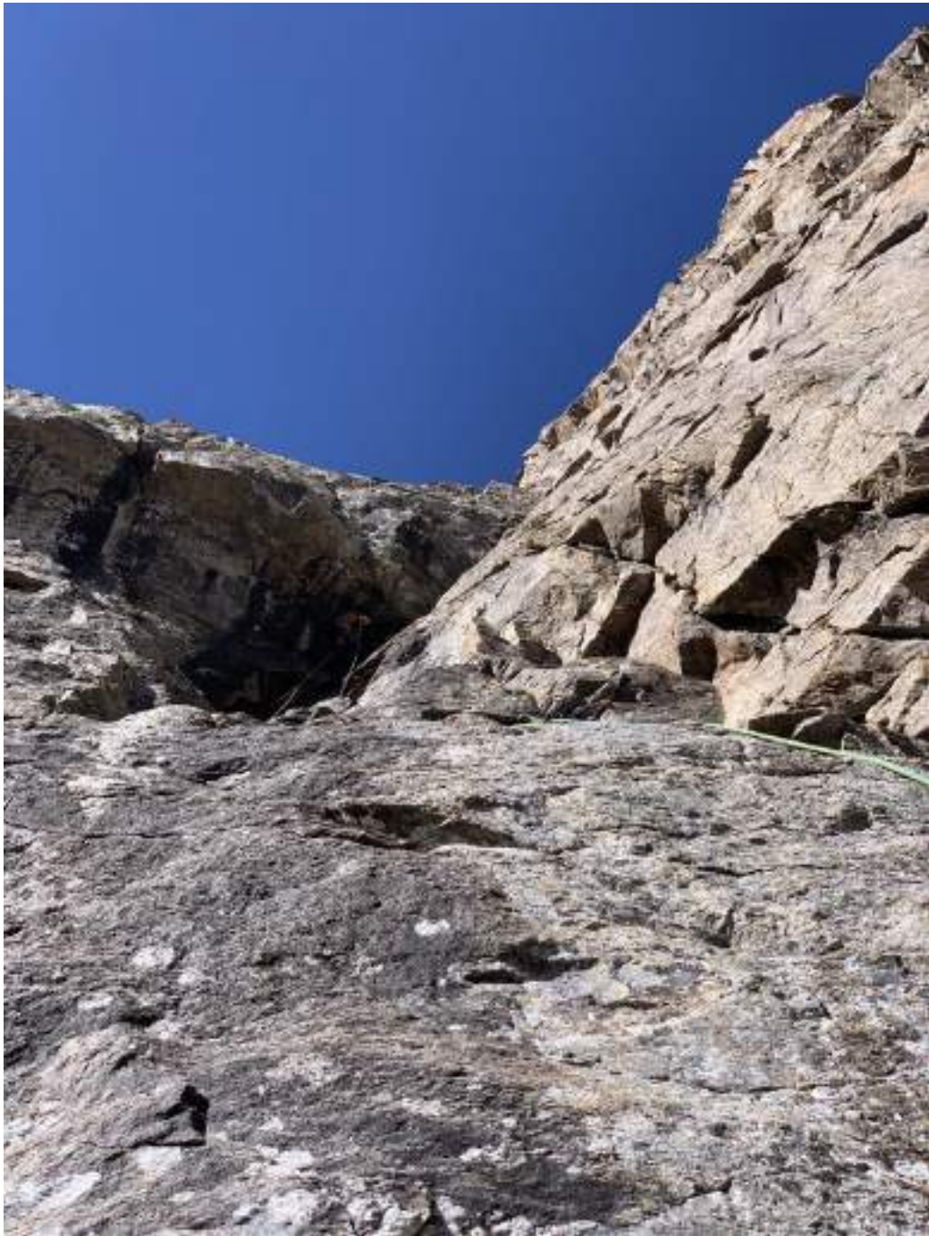
Рис. 11. Фото лидера R6-R7 (фото сделано 13.08.2024)