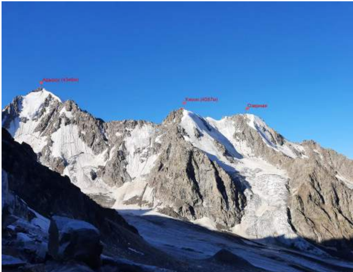
Рис.4. Панорама района восхождения (фото сделано выше Средних Кичкидарских ночевок 08.08.2024 г.)