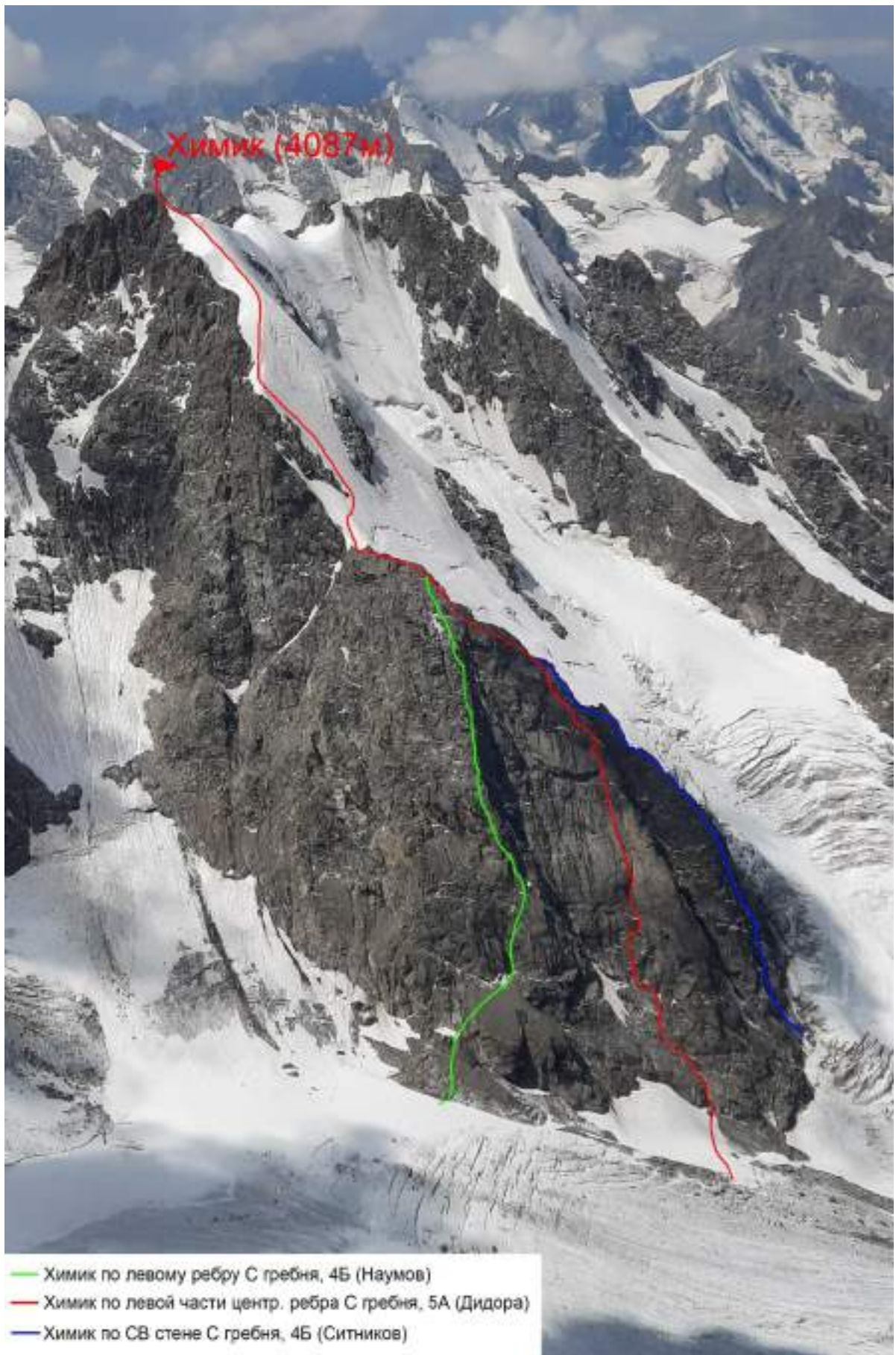
Рис. 1. Общее фото вершины (фото сделано 5.08.2021 с ЮВ гребня в. Юном)