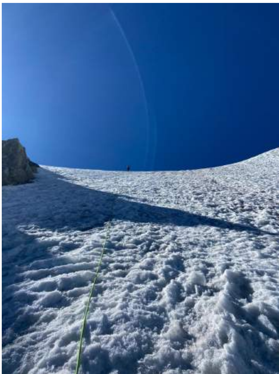
Рис. 12. Фотография с R12-R13 на лидера (фото сделано 14.08.2024)