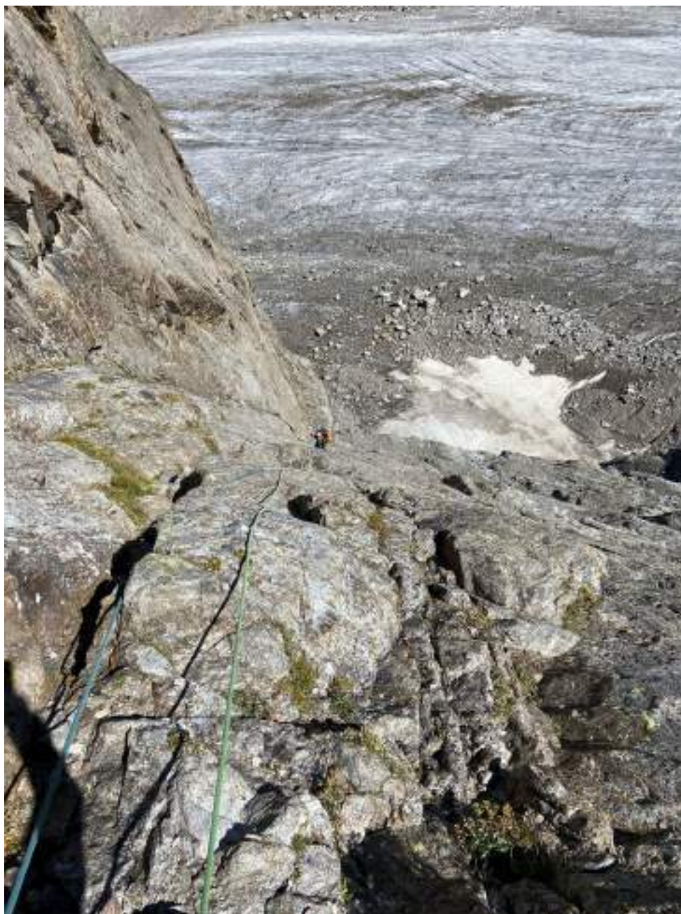
Рис. 10. Фотография с R7 на второго участника (фото сделано 13.08.2024)