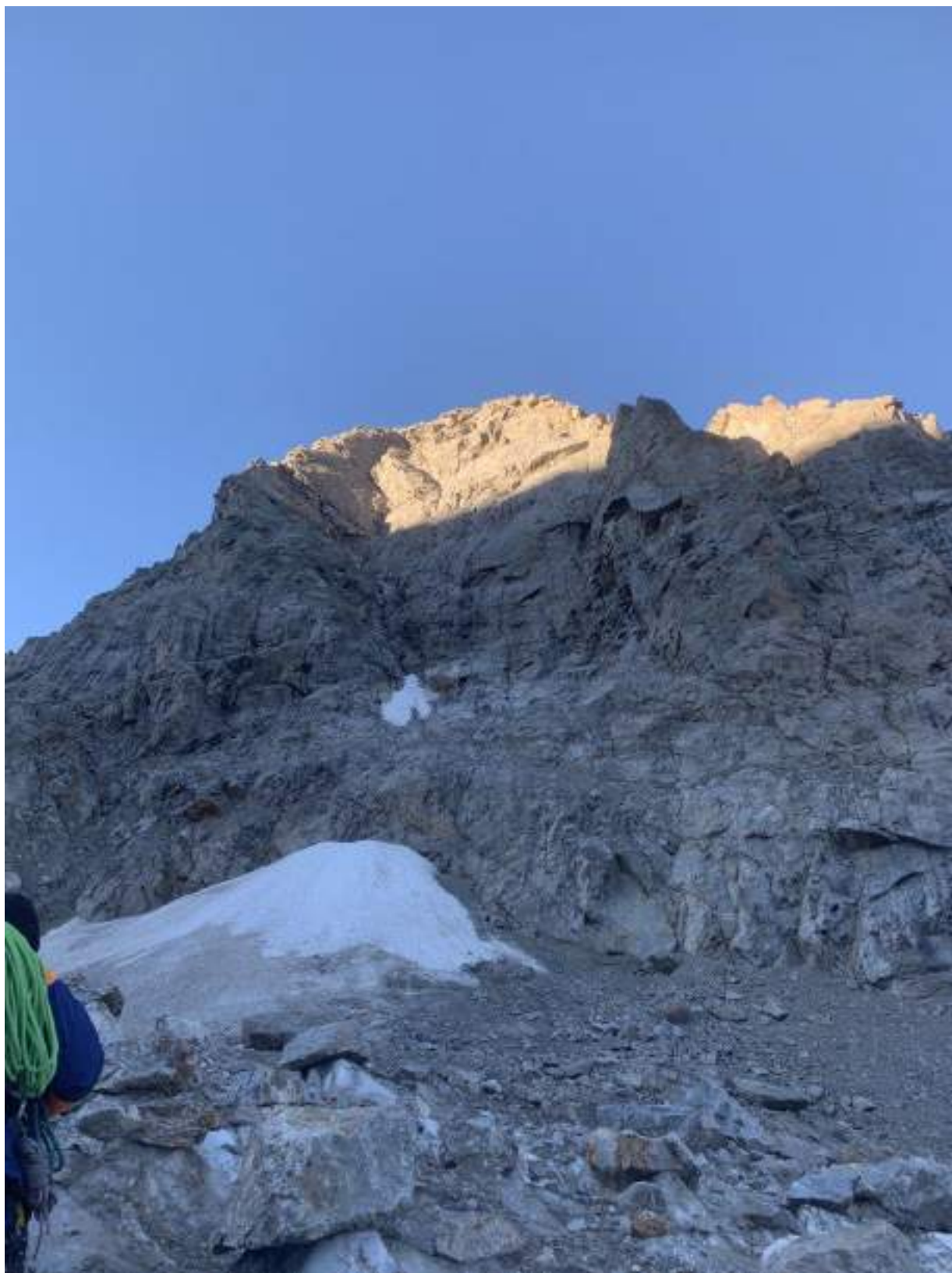
Рис. 9. Фотография стенной части маршрута утром 13 августа в 7:30 (фото сделано 13.08.2024 у подножья пика Химик)