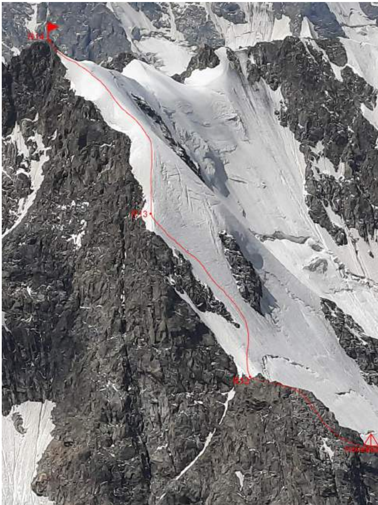
Рис. 8. Техническая фотография ледово-снежной части маршрута (фото сделано 10.08.2024 с ЮВ гребня в. Юном)